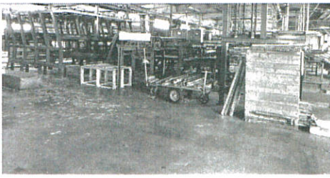
組合製材工場設備投資が完成

の地域の木 点として君 売している。また、乾 燥材志向が高まってい ることから乾燥機2基 を設備投資し、乾燥材 生産に乗り出した。